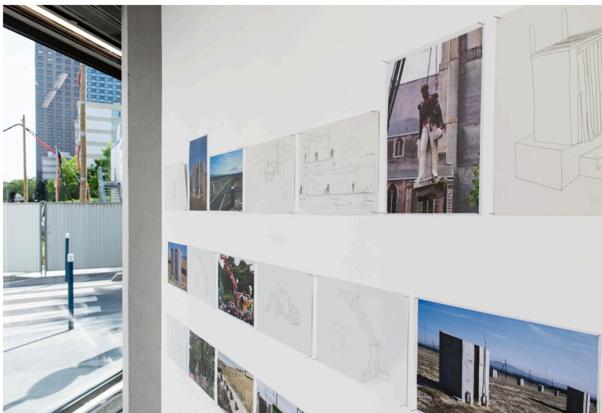
Ângela Ferreira, #BucketsystemMustFall, vue d'installation, Ygrec-ENSAPC, Aubervilliers