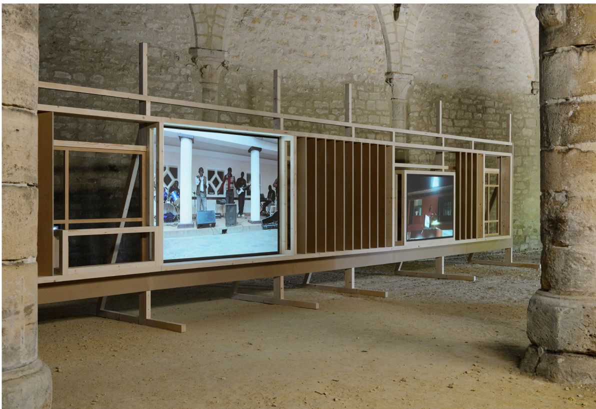
Ângela Ferreira, Indépendance Cha Cha , vue d'installation, Abbaye de Maubuisson, © Conseil départemental du Val-d'Oise - Photo : Catherine Brossais 2021