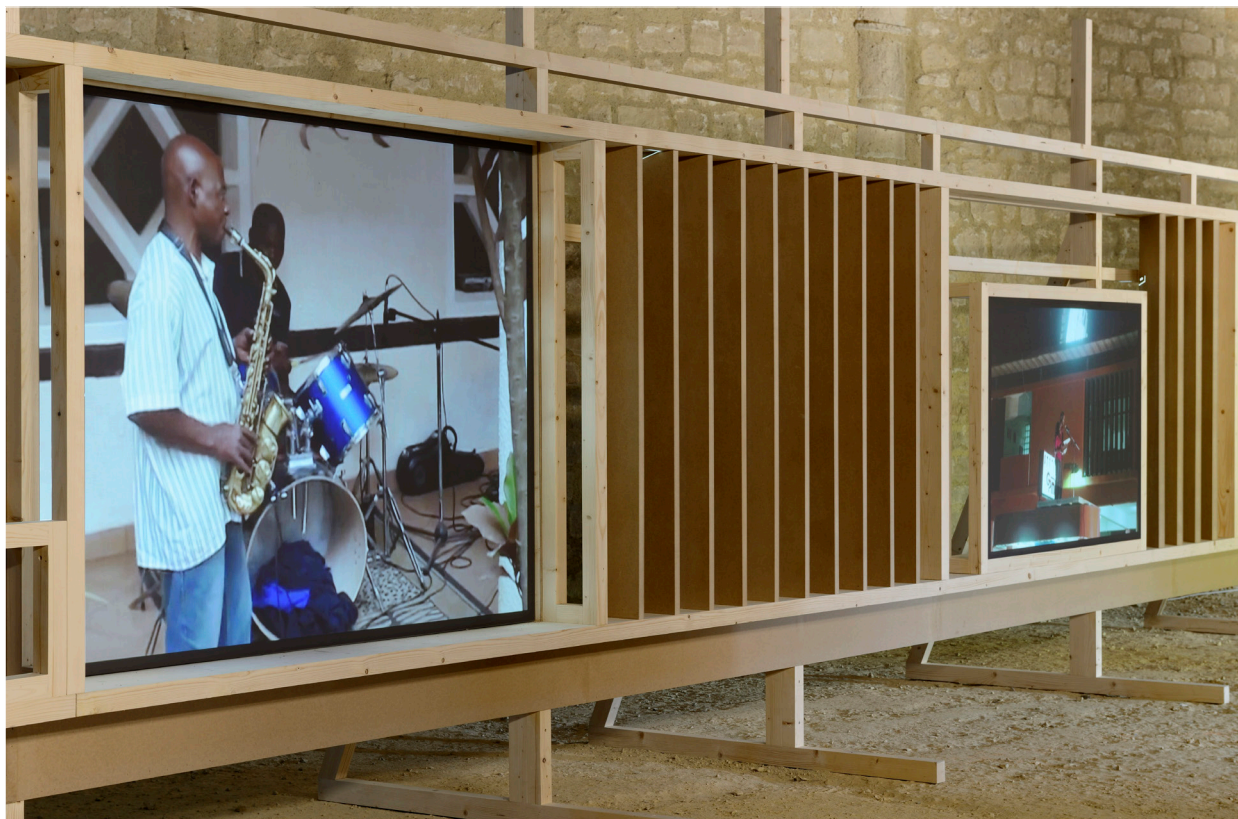
Ângela Ferreira, Indépendance Cha Cha , vue d'installation, Abbaye de Maubuisson