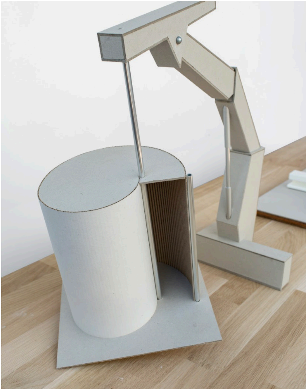
Ângela Ferreira, #BucketsystemMustFall, vue d'installation, Ygrec-ENSAPC, Aubervilliers