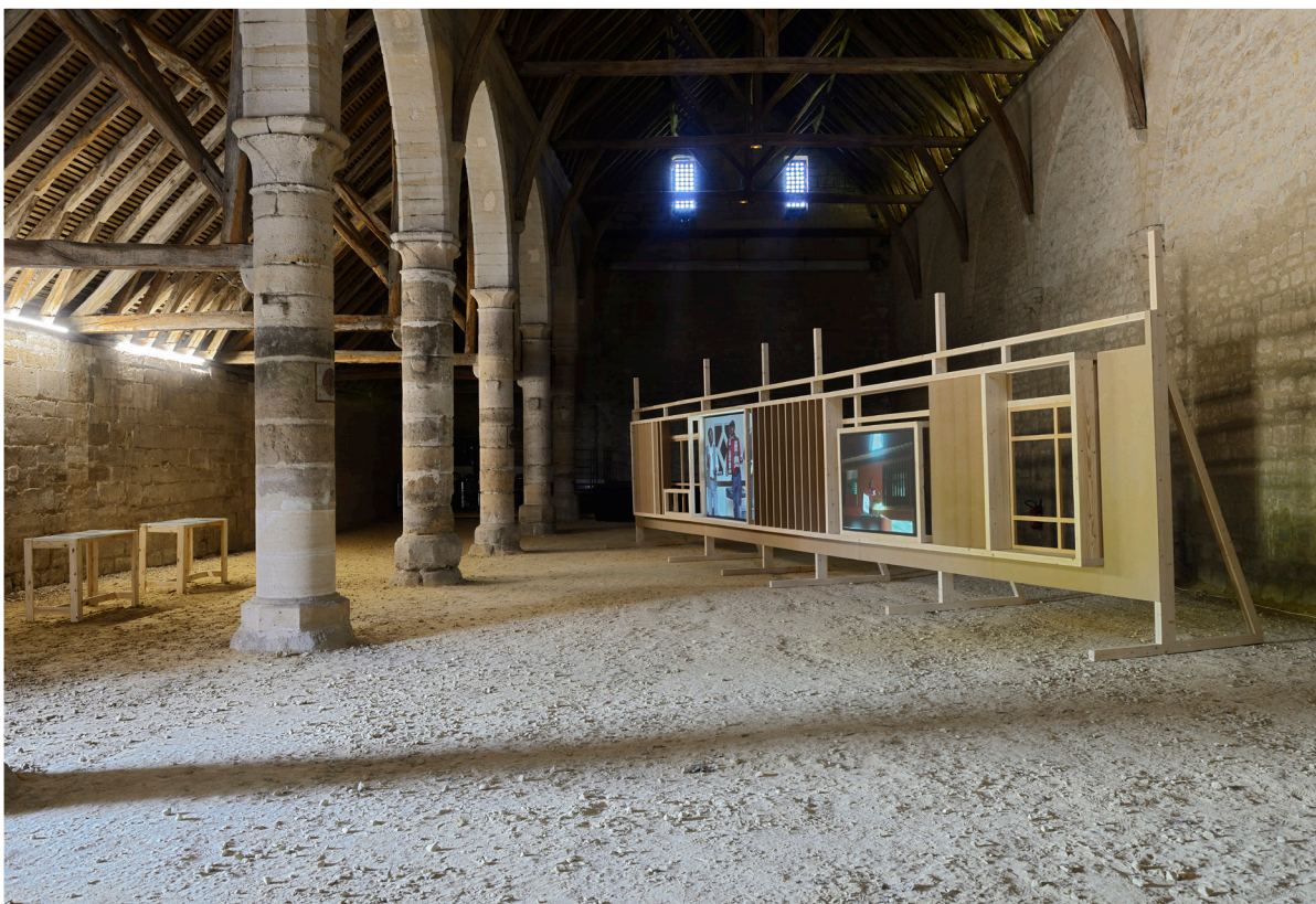
Ângela Ferreira, Indépendance Cha Cha , vue d'installation, Abbaye de Maubuisson, © Conseil départemental du Val-d'Oise - Photo : Catherine Brossais 2021