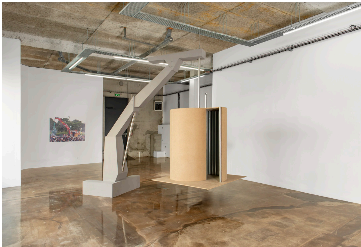
Ângela Ferreira, #BucketsystemMustFall, vue d'installation, Ygrec-ENSAPC, Aubervilliers