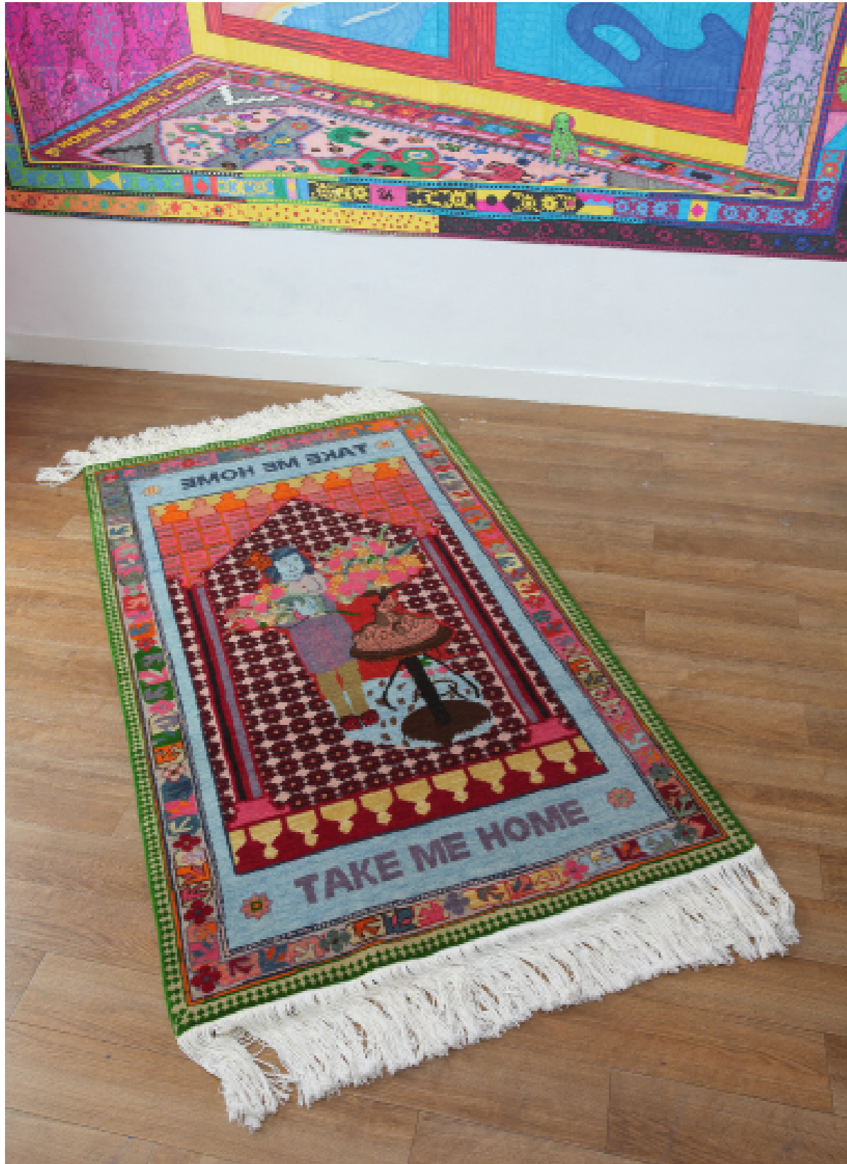
Araks Sahakyan : Vue l'accrochage au Drawing Factory. Installation : tapis, dessins, peinture, 2021.