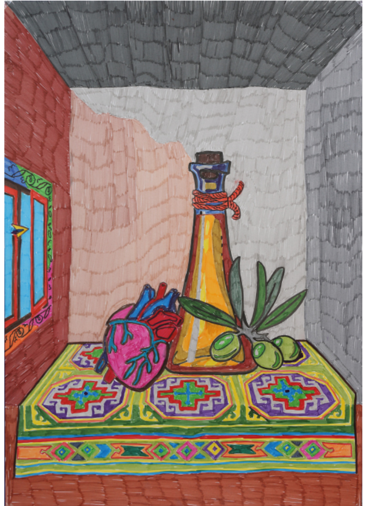
Araks Sahakyan : « Corazones de aceite » ou d'après Memling : Orient-Occident , feutres pigmentaires sur papier bristol, 59.4 x 42 cm, 2021. © Objets Pointus