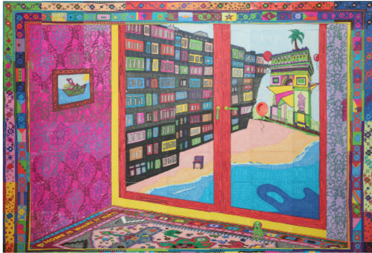
Araks Sahakyan : Todas las ventanas de mi casa / Toutes les fenêtres de ma maison , assemblage de 81 feuilles A4, Feutres sur papier, 181 x 251 cm, 2021 © Objets Pointus