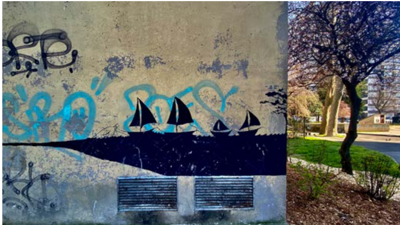
Collectif 93 Grand Angle, Sans titre , Aubervilliers, 2022

Philippe Fenwick est auteur, photographe, réalisateur, metteur en scène et comédien. Il a publié entre autres Un Théâtre qui marche (Actes Sud) et Brest-Vladivostok, journal d'un enthousiaste (Les Équateurs). Photographe, il a exposé aux Éditions du Pacifique et au Théâtre National de Marseille la Criée. Il a réalisé Hier ce sera mieux , film sur la transmission à Saint-Denis projeté au Cinéma des Cinéastes (Paris) à l'Écran (Saint-Denis) et au Festival du film indépendant de Casablanca. Il a également écrit et réalisé des pièces présentées notamment au Palais des Papes (Avignon), au 104 (Paris), à la Galerie de la station de métro Palais Royal (Paris), à l'Académie Fratellini (Paris), au MuCEM (Marseille), au Grand Palais (Paris), à l'Opéra de Marseille, à la Friche La Belle de Mai (Marseille), à la Mairie de Paris.