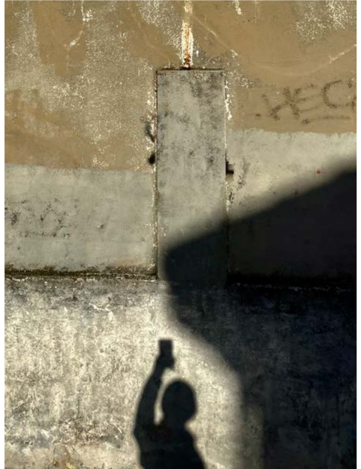
Collectif 93 Grand Angle, Sans titre , Aubervilliers, 2022