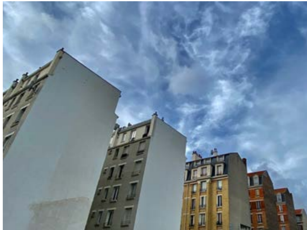
Collectif 93 Grand Angle, Sans titre , Aubervilliers, 2022