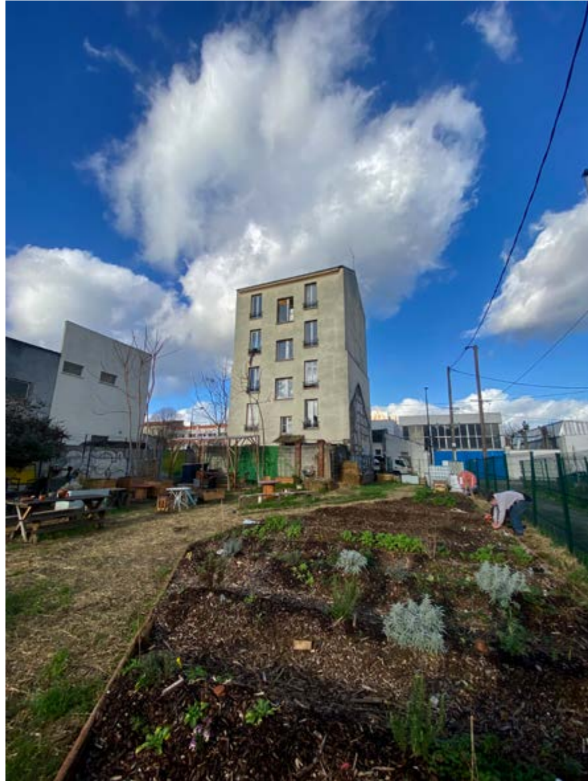
Collectif 93 Grand Angle, Sans titre, Aubervilliers, 2022