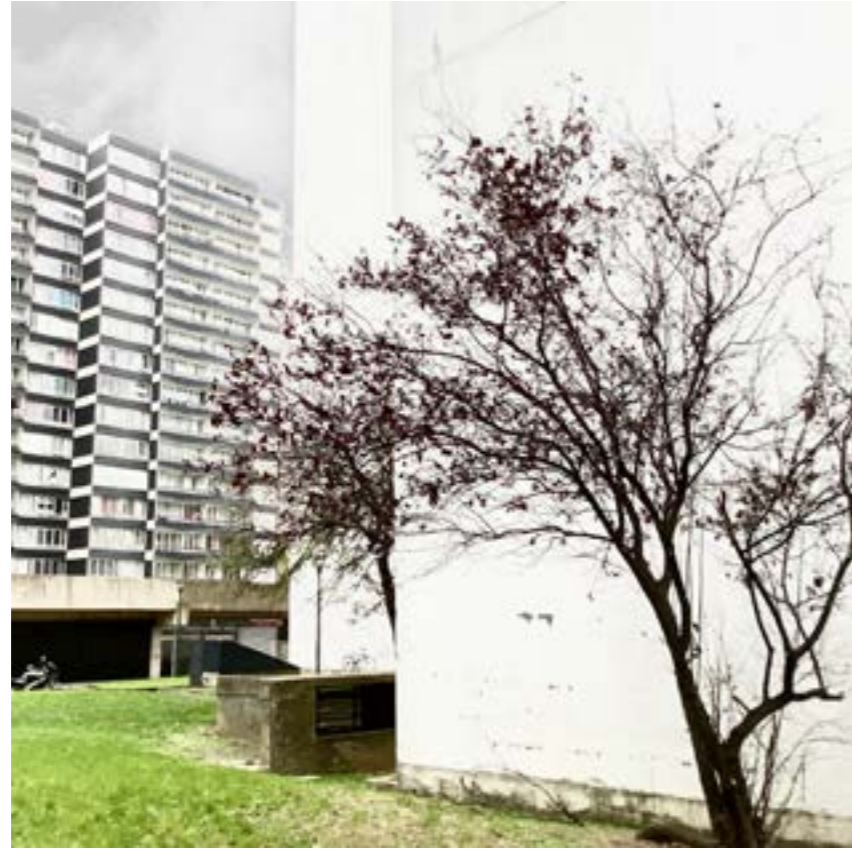
Collectif 93 Grand Angle, Sans titre , Aubervilliers, 2022