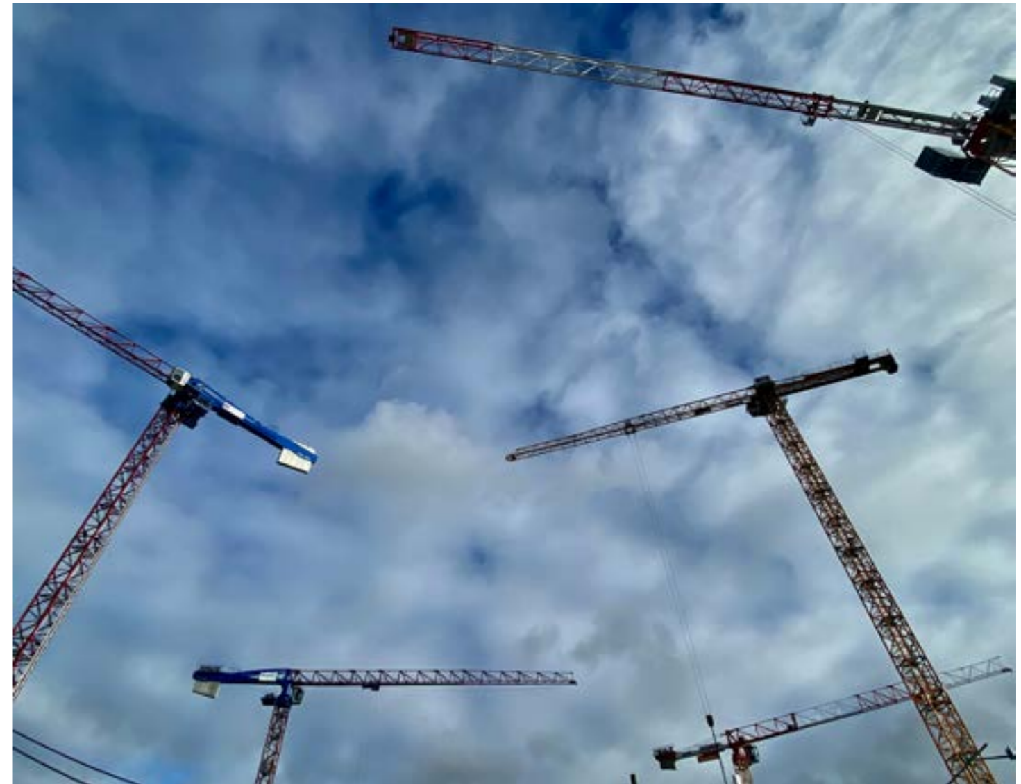
Collectif 93 Grand Angle, Sans titre , Aubervilliers, 2022