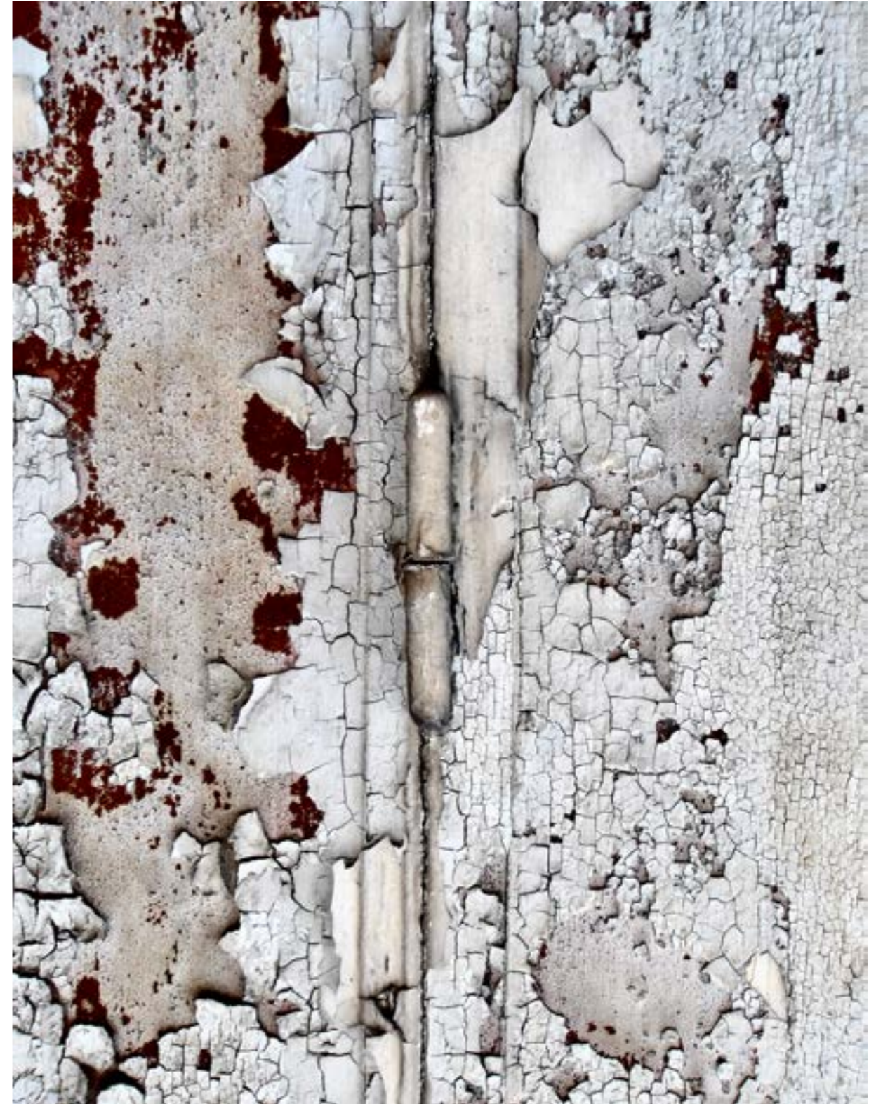
Collectif 93 Grand Angle, Sans titre, Aubervilliers, 2022