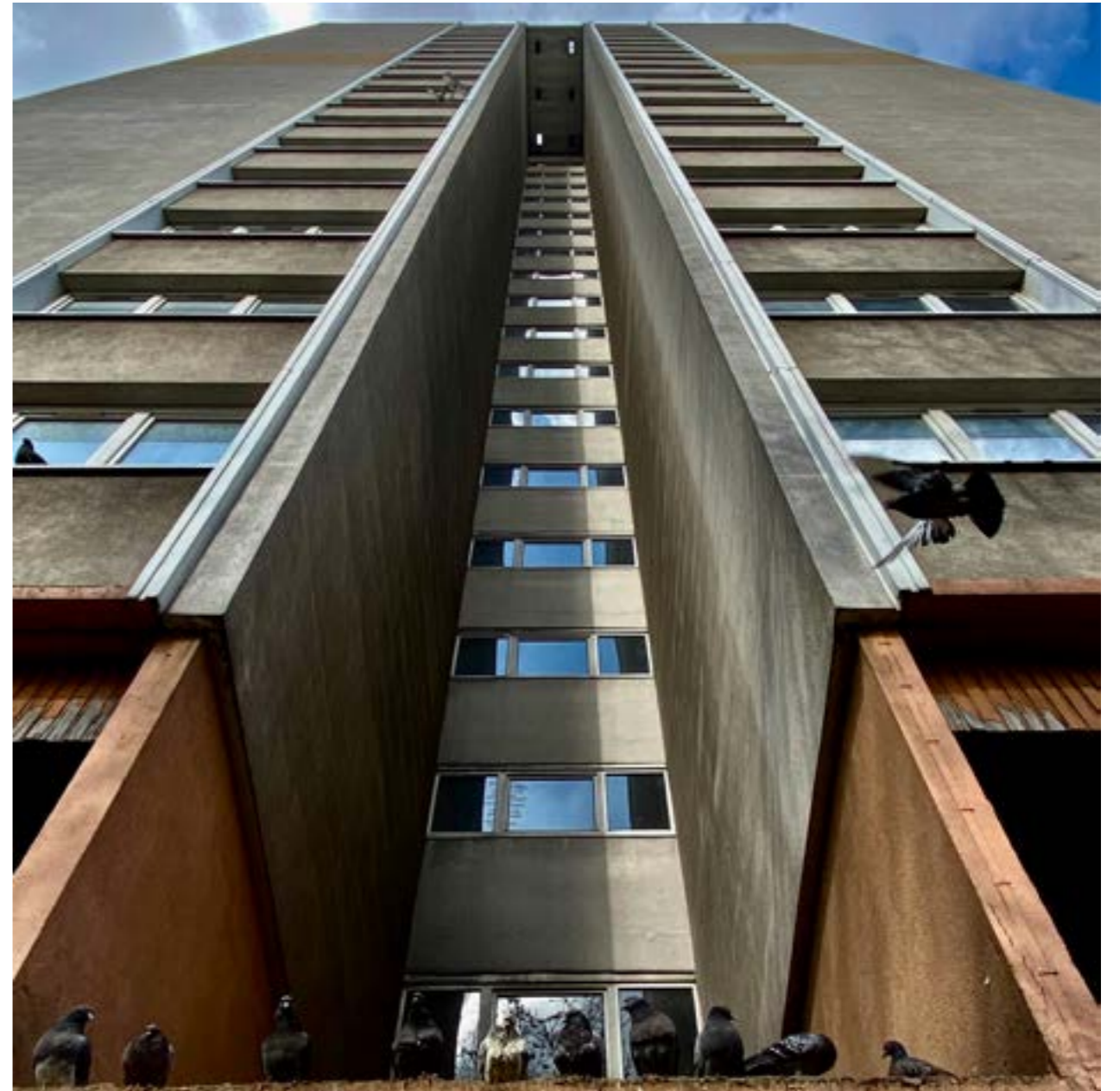
Collectif 93 Grand Angle, Sans titre , Aubervilliers, 2022